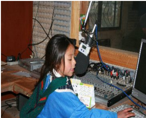
Ilustración 10: Integrante de Jënpoj en actividades de locución “la chispa infantil”. Septiembre de 2009.