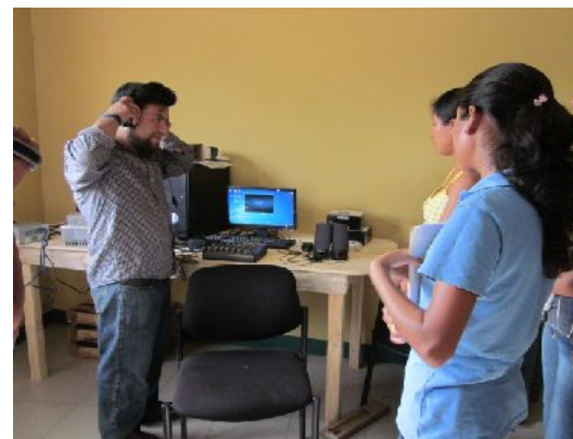
Ilustración 4: Instalación de equipo técnico. A la izquierda integrante de Japëxunk haciendo demostración