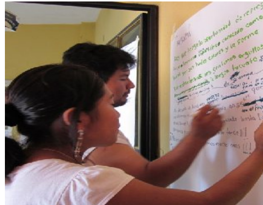
Ilustración 2: Integrante de la radiodifusora y facilitador de Japëxunk en ejercicio de identidad de la radiodifusora