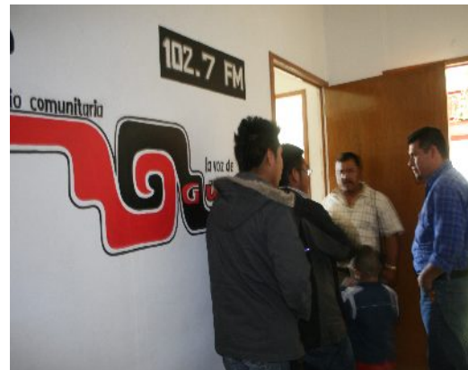
Ilustración 6: Visita a las instalaciones, ubicadas en la agencia municipal de San Pablo Güila.