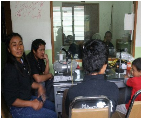
Ilustración 7: Integrantes de la radiodifusora y de Japëxunk en entrevista por el 1er. aniversario. Agosto 2011