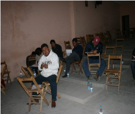
Ilustración 5: Integrantes de La Voz de Güila. Taller de acompañamiento en la gestación de la radio. Auditorio de la agencia municipal San Pablo Güila.