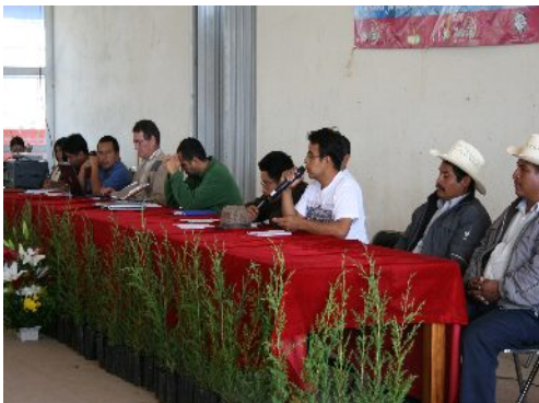
Ilustración 9: Encuentro de radios comunitarias. En la imagen autoridad de Bienes Comunales de Tlahuitoltepec. Asistentes de radios comunitarias de Oaxaca e integrantes de Japëxunk, S.C. Mercado municipal, Sta. María Tlahuitoltepec, 2008