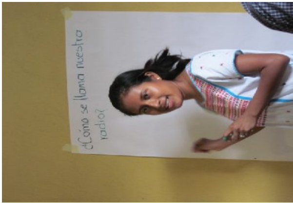
Ilustración 1: Formación y surgimiento de la radiodifusora. Instalaciones del Consejo Tacuate, Octubre 2010. Integrante de la Voz del pueblo Tacuate anotando las propuestas de sus compañeras.