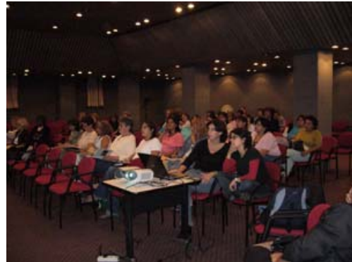
Imágenes Taller General sobre las TICs IMM Salón Rojo/ 28 de Marzo 2007