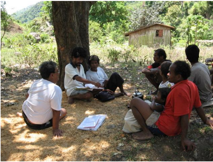
Meeting with Kinaboan Tribal Council on the preparation of Community Resolution.