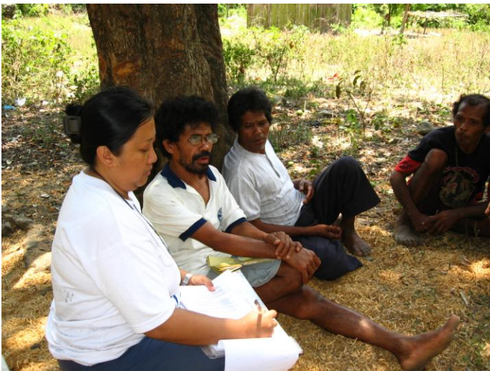
Signing the “Kasunduan” (Partnership Agreement between PCIM and the Dumagat Community of Sitio Kinaboan