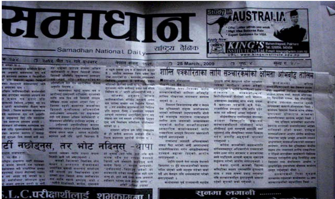
[Front page news on Samadhan National Daily, issued from Pokhara: ‘Capacity building training to journalists on Peace journalism’]