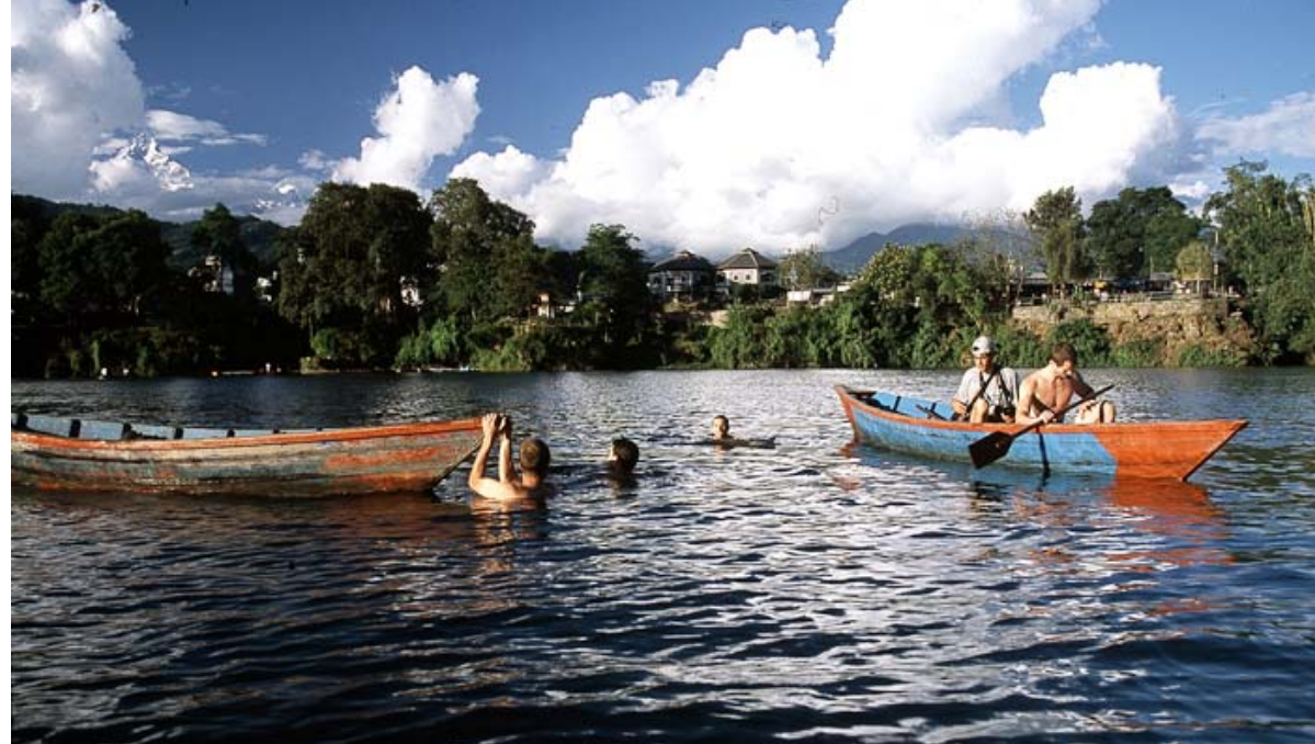
Figure 3 -The beautiful lake outside the training venue, Fewa Lake in a shiny day.