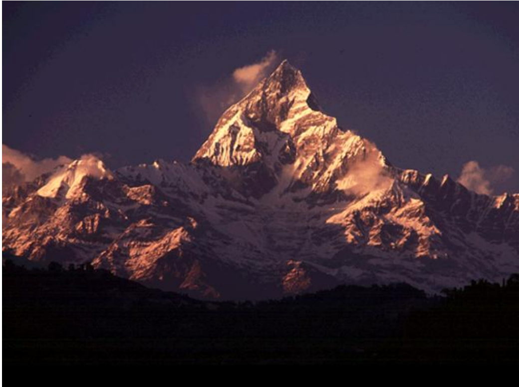
Figure 1-The prestine and enchanting Mt. Annapurna, one of the top ten heighest mountains in the world, which is visible from the training venue in Pokhara.