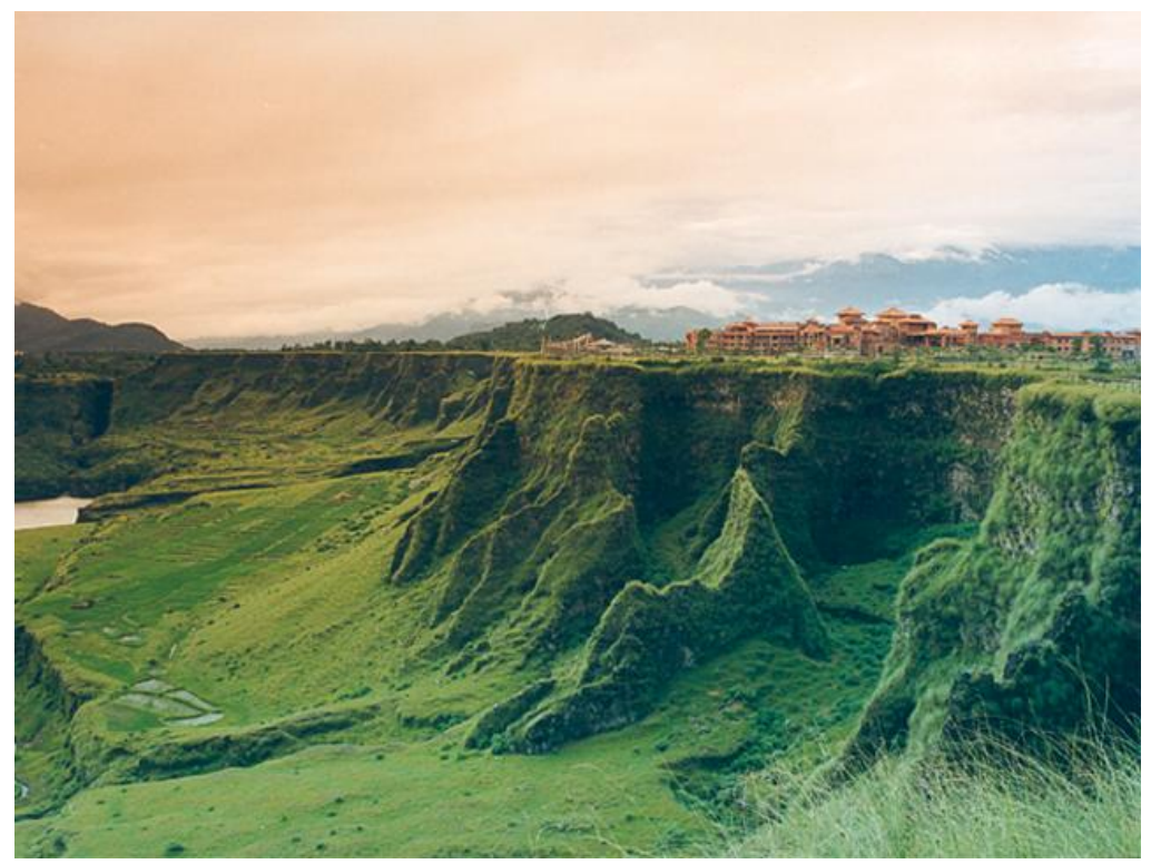
Figure 2- A gorge created by River Seti, flowing besides the training venue in Pokhara