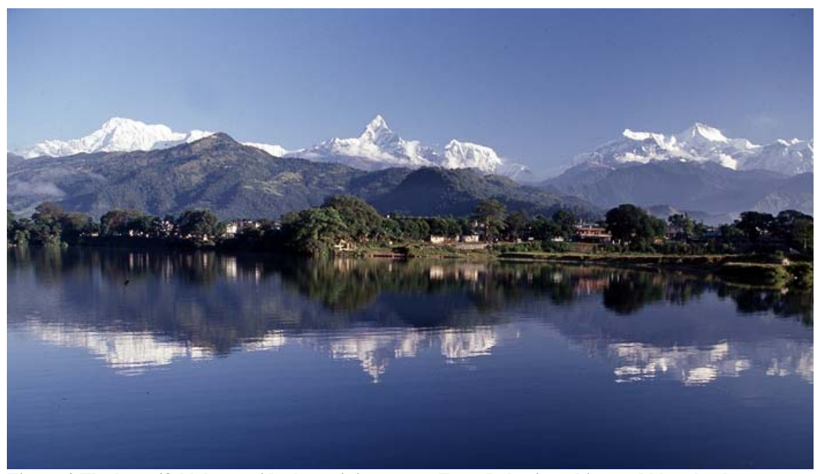
Figure 4-The beautiful lake outside the training venue, Fewa Lake, in a shiny and blue sky day, a studio pic.

[For details please contact:] KR Sigdel Subaltern Forum POB 8978 CPC 58 Anamnagar, Kathmandu Tel: +977 9842 322984 +977 012333224 subalternforum@gmail.com mail@simant.co.cc